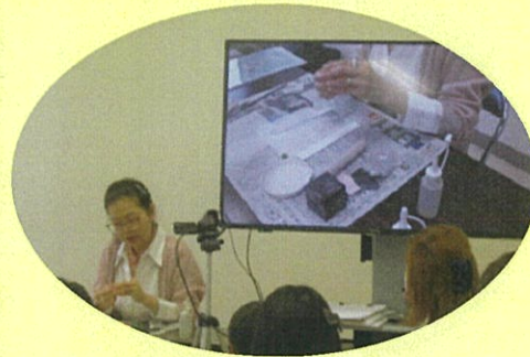
モニターを使って手元もバッチリ