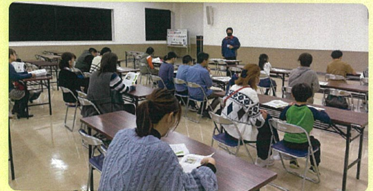
銀のリサイクルについて～