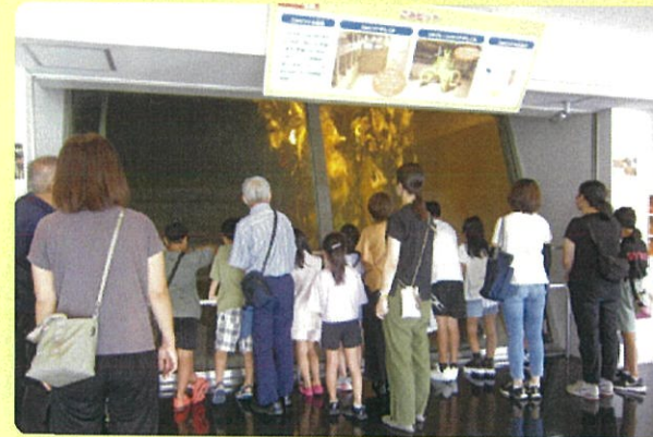
施設見学は初めての方もおられました。