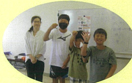
完成した作品を持って 笑顔で記念撮影！